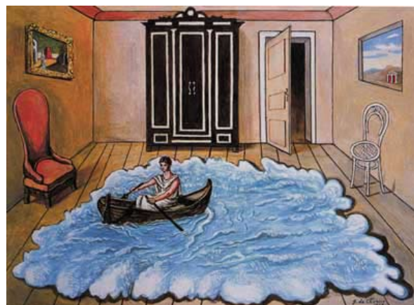
Giorgio de Chirico, Le retour d'Ulysse , 1968

Giorgio de Chirico est reconnu comme fondateur de l'esthétique surréaliste. Son tableau Portrait prémonitoire de Guillaume Apollinaire était intitulé Homme-cible lors de sa création. L'histoire de cette toile a profondément marqué le mouvement surréaliste. En effet, le profil en ombre chinoise de Guillaume Apollinaire qui apparaît au second plan comporte un cercle blanc sur la tempe, une cible. C'est à cet endroit que le poète sera atteint par un éclat d'obus durant la guerre. Cette coïncidence a été interprétée comme un signe du destin par Apollinaire lui-même.