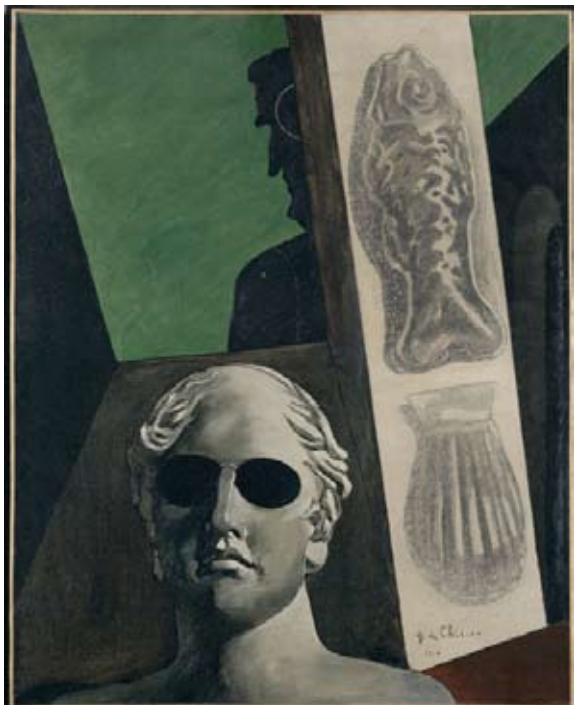
Giorgio de Chirico, Portrait prémonitoire de Guillaume Apollinaire , 1914