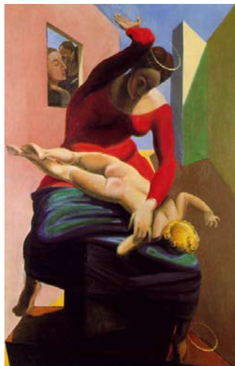
Max Ernst, La vierge corrigeant l'enfant Jésus , 1926