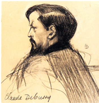
Claude Debussy (1862-1918), dessin d'Achille-Émile-Othon Friesz.

🔊 Ecouter un extrait du Clair de lune de Debussy (2.47 min)