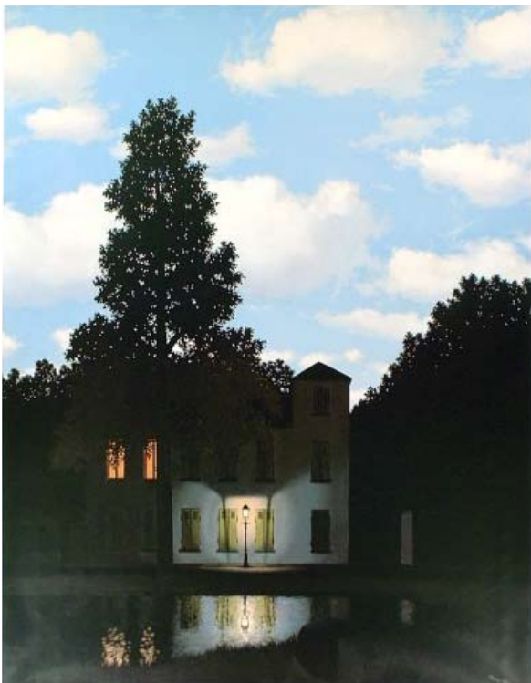
René Magritte, L'empire des lumières , 1954

Ses peintres favoris sont des surréalistes : René Magritte, Max Ernst et Giorgio de Chirico. Des artistes qui font surgir le surnaturel et le désordre dans l'ordre apparent des choses.